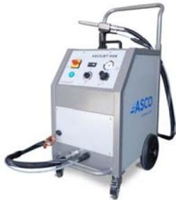
Bild 2 – Dank einer integrierten Pelletmühle erlaubt der ASCOJET 608 das Strahlen mit feinsten Eispartikeln, was eine noch schonendere Reinigung der Formen und Oberflächen garantiert.

Bild 1 – Zahlreiche Besucher nutzten die Gelegenheit, um sich am ASCO Stand genauer über Formenreinigung mit Trockeneis zu informieren.